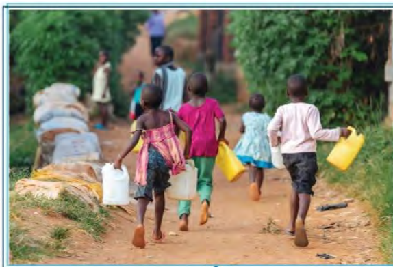
Děti nesoucí kanistry s vodou v Ugandě, Afrika

využívalo 71 % světové populace nezávadnou upravenou pitnou vodu, která je k dispozici káykoli.